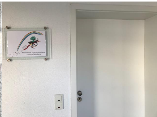
Eingang zum Gruppenraum: