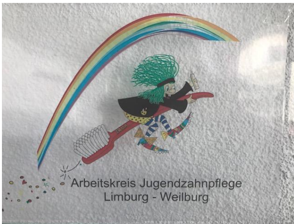
Beschilderung der Jugendzahnpflege: